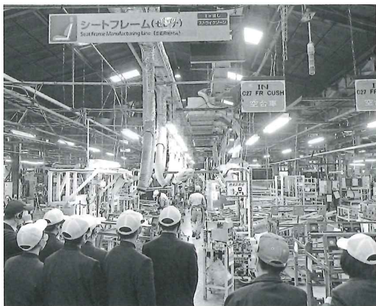
金属部品工場を見学する青豊高校生

今回は青豊高校2年生のうち、卒業後に就職を希望する生徒と、進学した後に豊前市で就職を考えている生徒30人を対象に行われ、大分製紙(株)豊前工場、