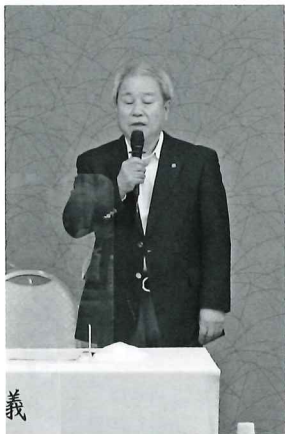
総会で挨拶する宮房会頭

役員・議員並びに会員の皆様には、今後とも商工会議所活動にご支援・ご協力賜りますようお願い申し上げます。